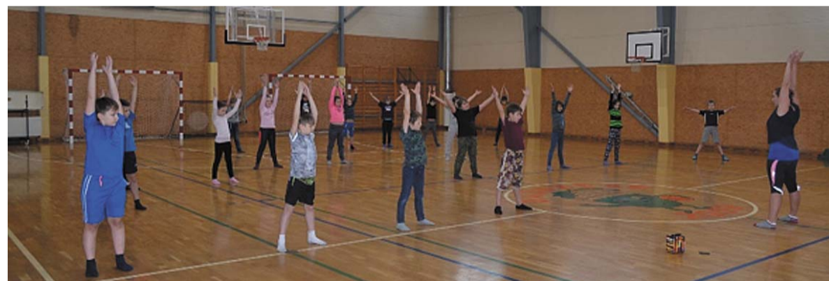
Aktīvi norit vingrošanas nodarbības visā novadā visām paaudzēm bērnudārzos, skolās un dienas centros.