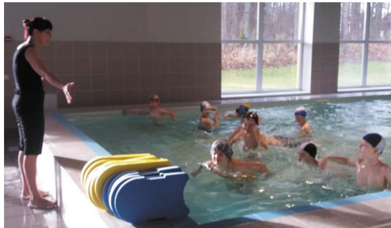
Sadarbojoties ar novada skolām, organizēti baseina apmeklējumi novada skolēniem, radot iespēju apgūt un nostiprināt savu peldētprasmi.

Īstenojot projektu, mudinām novada iedzīvotājus pievērsties veselīgam dzīvesveidam un savas