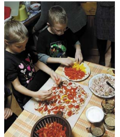
Esam pilnveidojuši savas teorētiskās un praktiskās (veselīgu uzskodu, musli, kokteiļu meistarklase) zināšanas veselīga uztura jomā bērniem, jauniešiem, jaunām māmiņām, pieaugušajiem, senioriem.